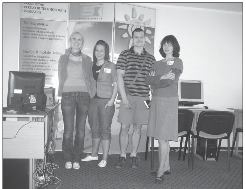
Su 100-uoju stojančiuoju į Šiaulių kolegiją