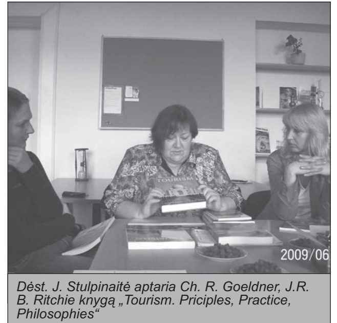
Dėst. J. Stulpinaitė aptaria Ch. R. Goeldner, J.R. B. Ritchie knygą „Tourism. Principles, Practice, Philosophies“

Buvo akcentuota, kad lietuvių kalba neišleista ne tik studijų programai realizuoti tinkama turizmo literatūra, bet jos neįmanoma rasti net laisvai pasirenkamųjų dalykų dėstytoji. Buvo vaizdžiai pademonstruoti ekologinio turizmo dviejų angliškų ir lietuviško leidinių skirtumai, deja, ne lietuviškojo naudai.