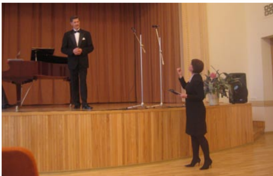
Koncerto metu vyravo šilta, šventinė nuotaika