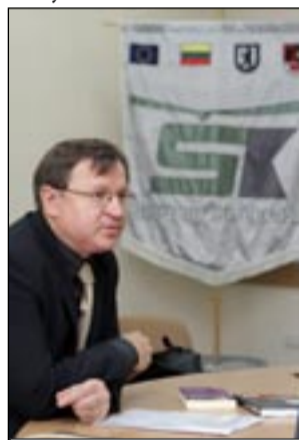
doc. dr. E. Vareikis