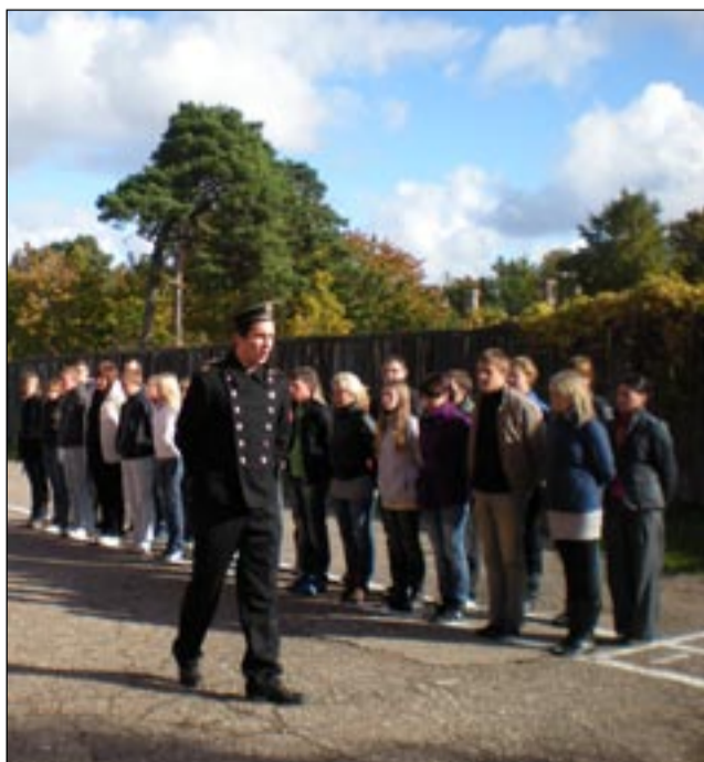
Drausmė ir paklusnumas. Į kalėjimą žengte mars...

Norėdama pritraukti kuo daugiau turistų, Liepoja atvėrė (1893 metais carinės Rusijos įkurtą, vėliau Sovietų Sąjungos išplėtotą) karinį miestelį, vadinamą „Karosta“. Tai vienas įdomiausių ir legendomis apipintų Liepojos objektų. Po 1905 metų revoliucijos Rusijos caro nurodymu „Karosta“ tapo areštine. Nors per šimtą metų daug kartų keitėsi Latvijos vyriausybės, tačiau areštinės paskirtis – bausti nusikaltusius – išliko. Buvusioje niūrioje jūreivių „gauptvachtoje“ (2007 m. pripažinta populiariausiu Latvijos turizmo objektu), suteikiama proga pasijusti areštuotoju ir dalyvauti ekstremalių nuotykių realybės šou „už grotų“ („Aiz restēm“). Dalyviai uždaromi į kameras, maitinami areštuotųjų maistu, tardomi, patikrinami medicinos punkte, fotografuojami, jiems skiriamos specialios užduotys, kurias turėdavo atlikti pakliuvusieji į realią „gauptvachtą“. Šou scenarijus sudėliotas taip, kad turistai tuo pačiu metu supažindinami ir su griežtojo kalėjimo istorija. „Dalyvavimas kalėjimo realybės šou buvo tikras iššūkis. Turėjome pasirašyti dokumentą, kad su viskuo sutinkame, nors nežinojome, kas mūsų laukia. Sunkiai sekėsi atlikti griežtas kalėjimo prižiūrėtojo komandas anglų kalba. Medicinos punkte patikrino mūsų sveikatą, kiekvienas buvo išardytas, už nepaklusnumą teko atlikti tokias fizines bausmes, kaip: „Vietnamietiška kėdutė“ – klūpėti, rankas sunėrus už galvos (Vita, GV2).