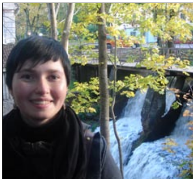
Latvijos rekordai - Aleksūpytės kriokliai (Aurelija, GV09)