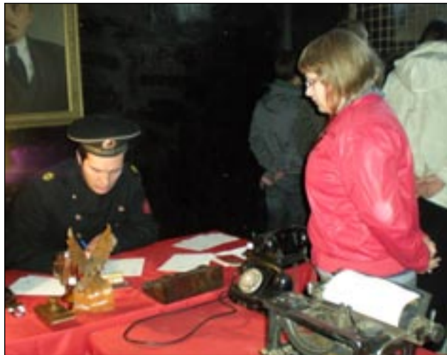
Tardoma GV09 pirmakursė papasakojo viską....