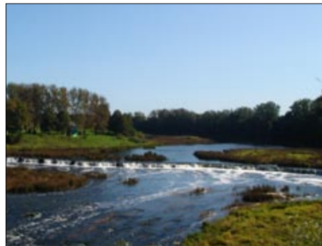
Plačiausias Europoje krioklys - Venta, praplėtėjusi Kuldigoje

„Pasijutome lyg kokiame senoviniame filme, kur laikas sustojo...“ (GV09).