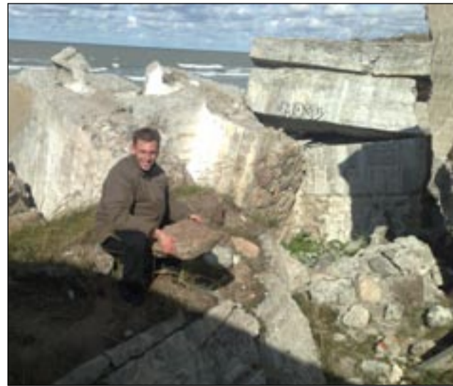
Mantas M.(GV2) prie Liepojos carinių pajūrio fortų