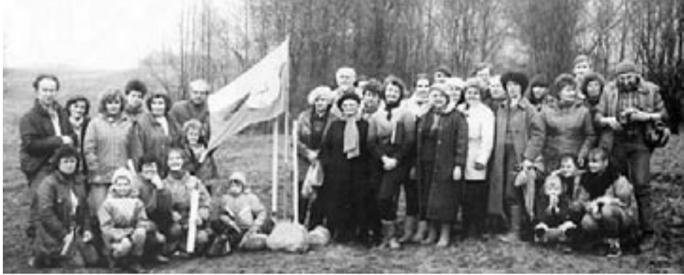
Pirmieji Knygnešių giraitės sodintojai

Lankytojai čia laukiami visada. Čia galima sužinoti apie Tautos atgimimo patriarcho ir jo šeimos gyvenimą. Pasivaikščioti po jau ūgtelėjusį ažuolyną, pasivažinėti karieta (brička), pajodinėti poniu, pasivaikšinti arbata.