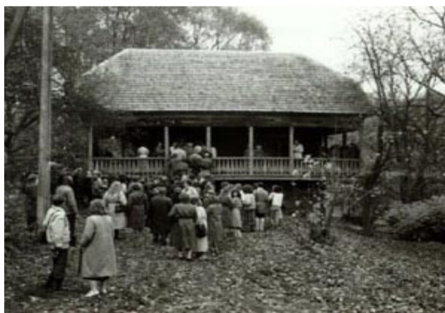
J. Tumo-Vaižganto ir knygnešių muziejus Ustronėje (Panevėžio rajonas)

"Žemaičių saulutė", "Voruta" (14 numerių), Marijampolės "Sugrįžimai", Vilniaus pedagoginio universiteto (tuo metu instituto) laikraščio "Šviesa", Kauno medicinos akademijos "Ave Vita".