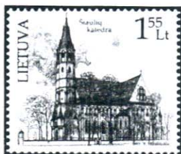
Apyvartoje pasirodė du nauji pašto ženklai iš serijos „Lietuvos bažnyčios“: viename iš jų vaizduojama Šiaulių katedra.

Šiaulių Šventųjų apaštalo Petro ir Pauliaus katedra – ryškiausias renesansinio manierizmo architektūros kūriny Lietuvoje. Jos baltas 70 metrų aukščio bokštas artėjant prie Šiaulių matosi iš tolo iš bet kurios pusės. Maždaug prieš 400 metų iškilęs statinys didingas, originalių architektūrinių detalių.