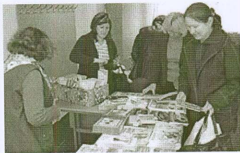
PIRKĖJAI: Prie vaikiškos literatūros prekystalio nusidriekė pirkėjų eilutė.