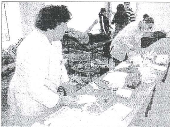
Sveikatos fakulteto studentai aktyviai dalyvavo neatlygintinos kraujo donorystės akcijoje.

kumentus gydymo įstaigoje ir taps potencialiais donorais, galinčiais padėti ypač sunkios būklės ligoniams.